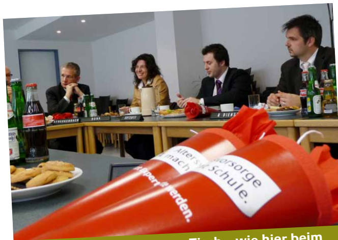
Alle AmS-Aktiven an einem Tisch – wie hier beim Runden Tisch im DRV-Servicezentrum Düren